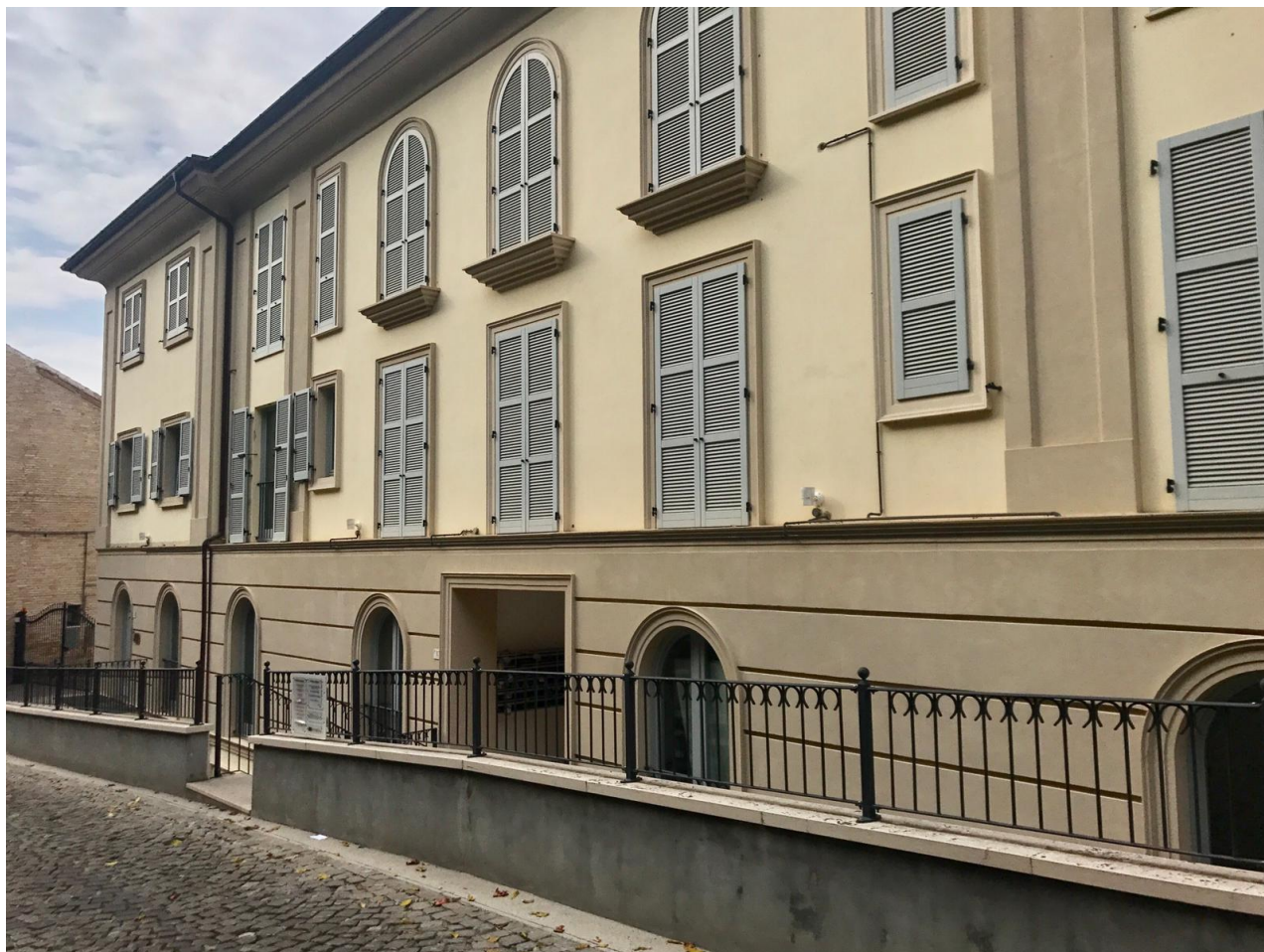
La sede dell'Ordine dei Commercialisti ed esperti contabili di Fermo